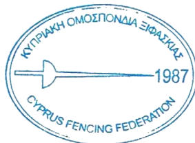
Χριστίνα Ιωάννα ΤΖΑΛΑΒΡΕΤΑ Γεν. γραμματέας